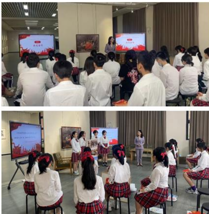
领悟“习语金句”，喜迎二十大主题班会