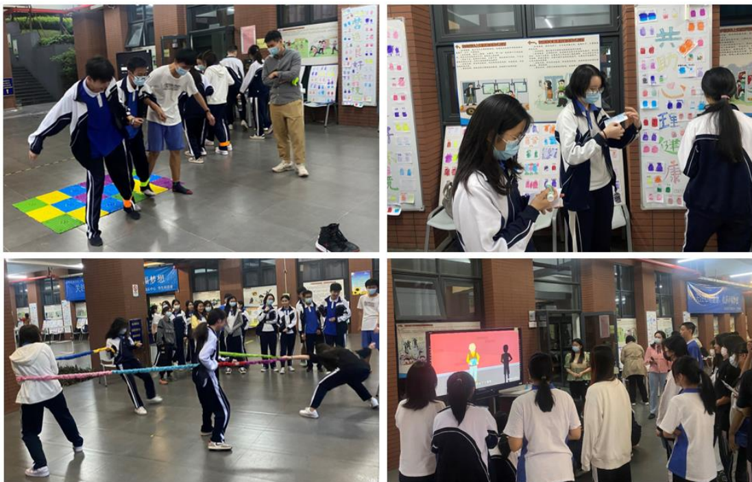
营造良好环境，共助心理健康——心理健康活动