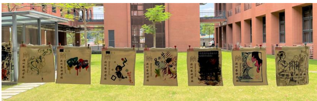
“新青年爱劳动”——我眼中的母校与百年历程绘制帆布袋活动