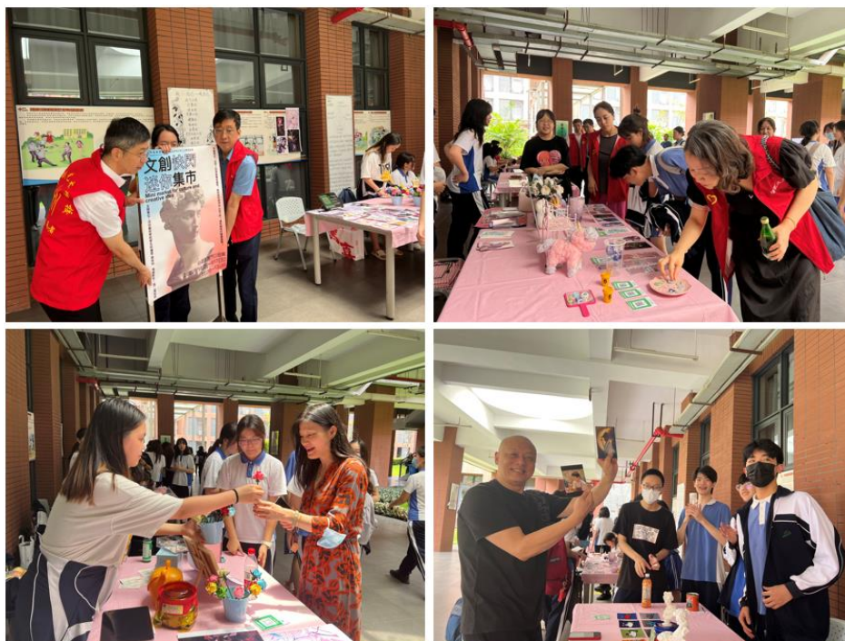
“文明风采”系列活动：文创快闪迷你集市