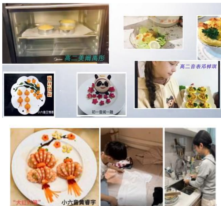
爱生活、爱劳动‘云’创作比赛