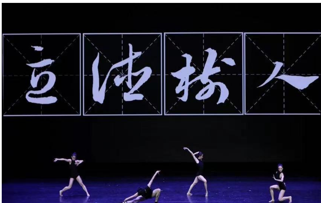
图 4：“中国田字格书法”舞蹈空间探索与身体即兴

融合，成为了思政教学的深厚力量。众多师生在其中感悟艺术之美，体验思政之实，接受心灵洗礼，获得思想升华。