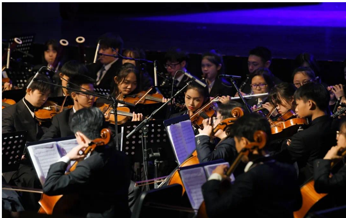
图 6: “华夏起源，母亲黄河”---《黄河》第四乐章展演