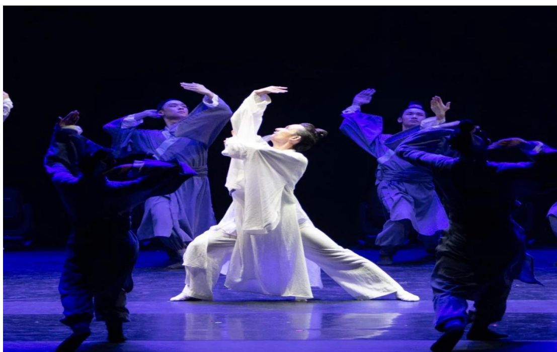
图 5：“道破东方智慧，传承中华文化”——舞蹈《弟子规》