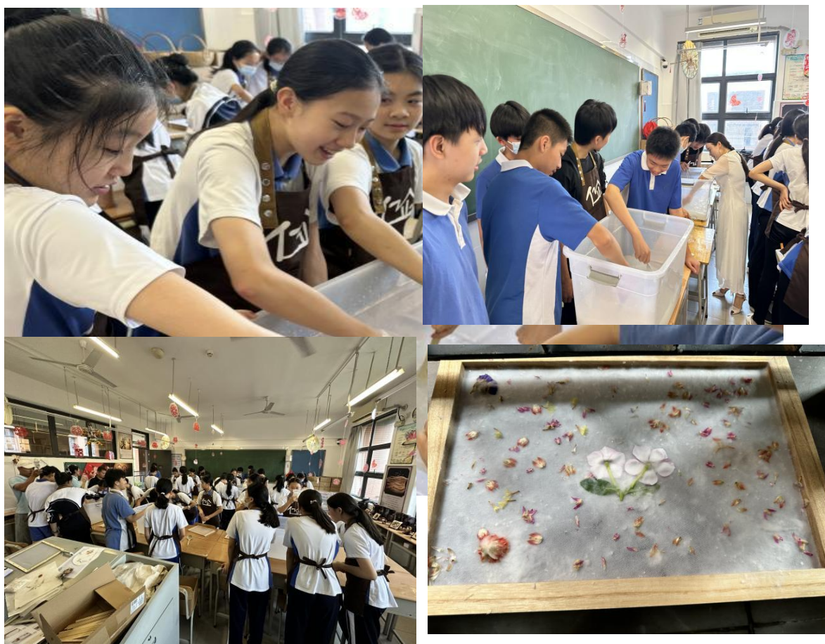
图 9：非遗古法造纸---劳动课程