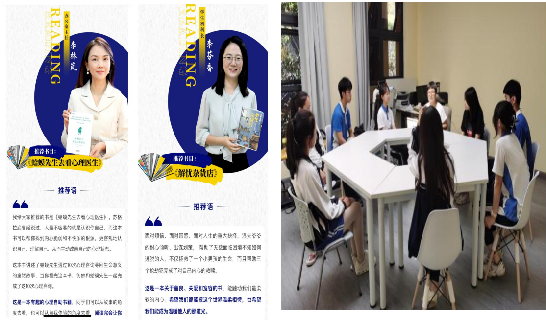
图 11：心理健康读书会

深圳艺术学校的校园里，总是弥漫着浓重的书香气息。这个秋冬，深艺师生沐浴在暖阳中。读人生漫漫，读世界莽莽……师生共读共享，校长教师领读，学生跟读。校长教师在这个过程中起到指导者和引领者的角色，他们应该引导学生正确阅读经典并理解其中的精神内涵。同时，学生们也可以与教师进行交流和讨论，共同分享阅读的乐趣和收获。