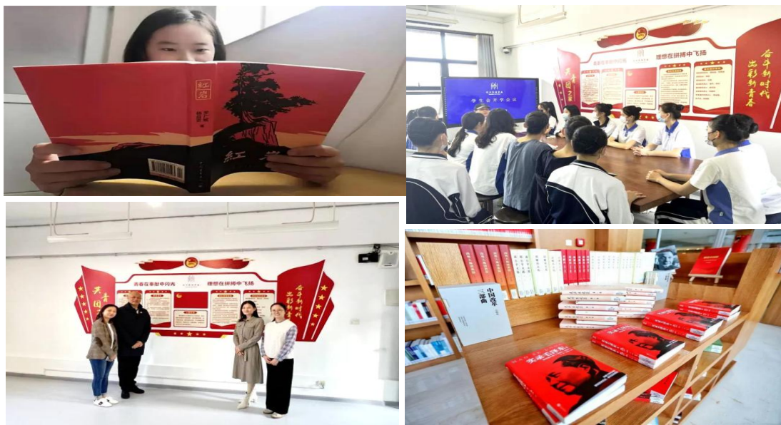
图 1：“读红色书籍，传承红色血脉” ----读书分享会

红色经典是我国革命历史上的重要文献和著作，具有深厚的思想内涵和时代价值。通过深入阅读和理解这些经典著作，学生们可以更好地领悟到伟大祖国的发展历程和英雄人物的奋斗精神。