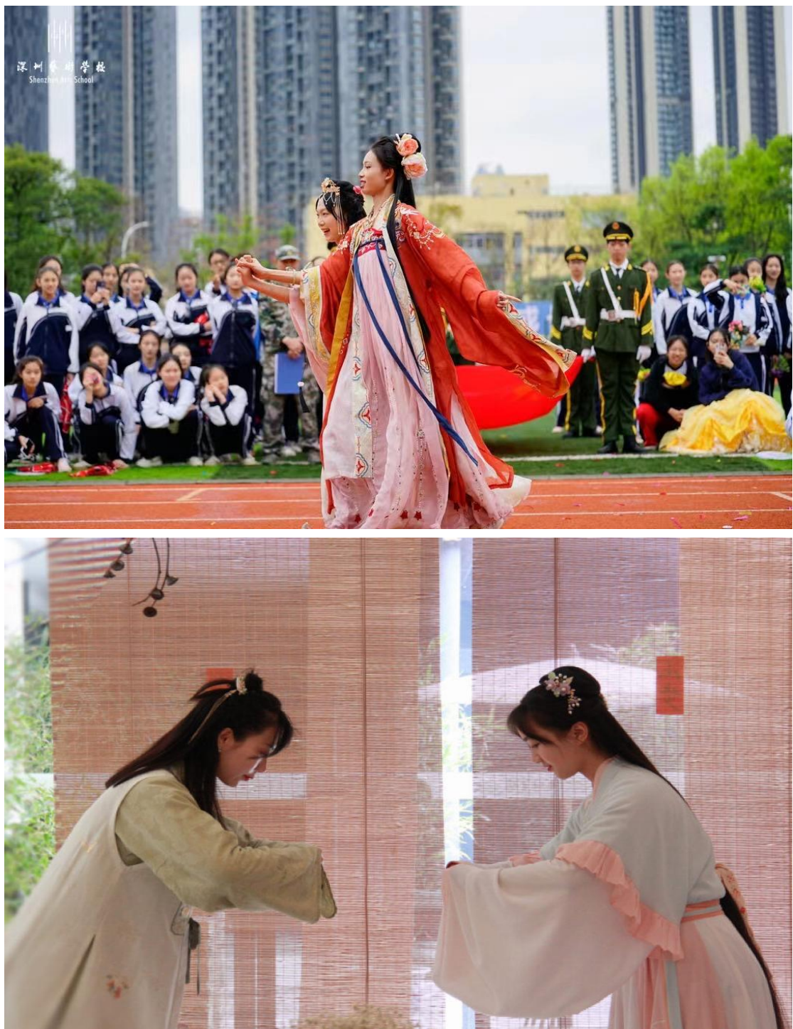
图 10：穿汉服，学礼仪---文化艺术节