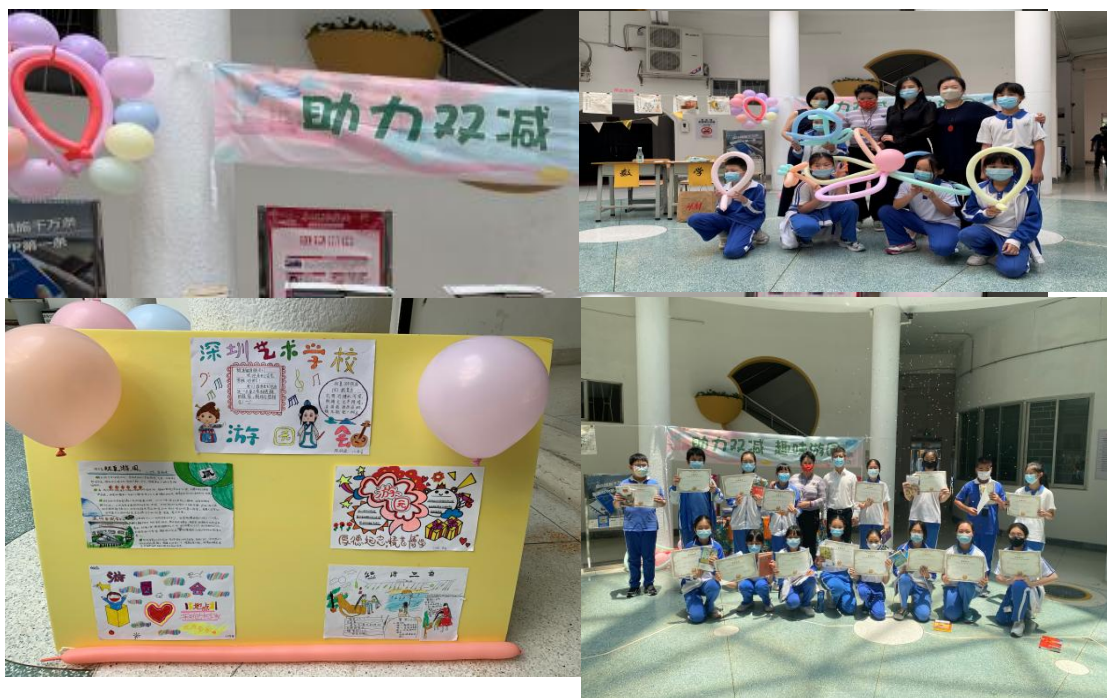
图 8：文化课程趣味游园活动