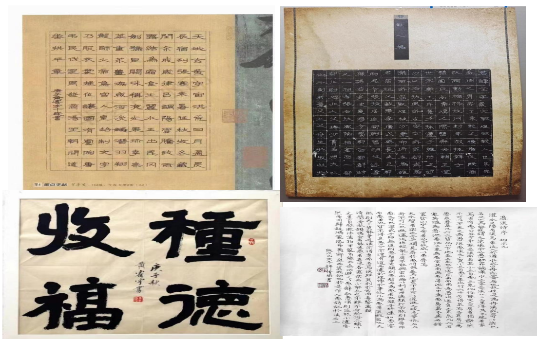
图 2：“用心书写，浸润心灵”——书法比赛

在活动中举办书法比赛，可以传承匠人匠心。书法是中国传统文化的瑰宝，也是一门艺术。通过书法比赛，学生们可以展示自己的书法才华，同时也能够学习到传统文化中的精髓和匠人精神。这种传承匠人匠心的活动不仅可以培养学生的审美意识和创造力，还能够让他们更好地了解和热爱中国传统文化。