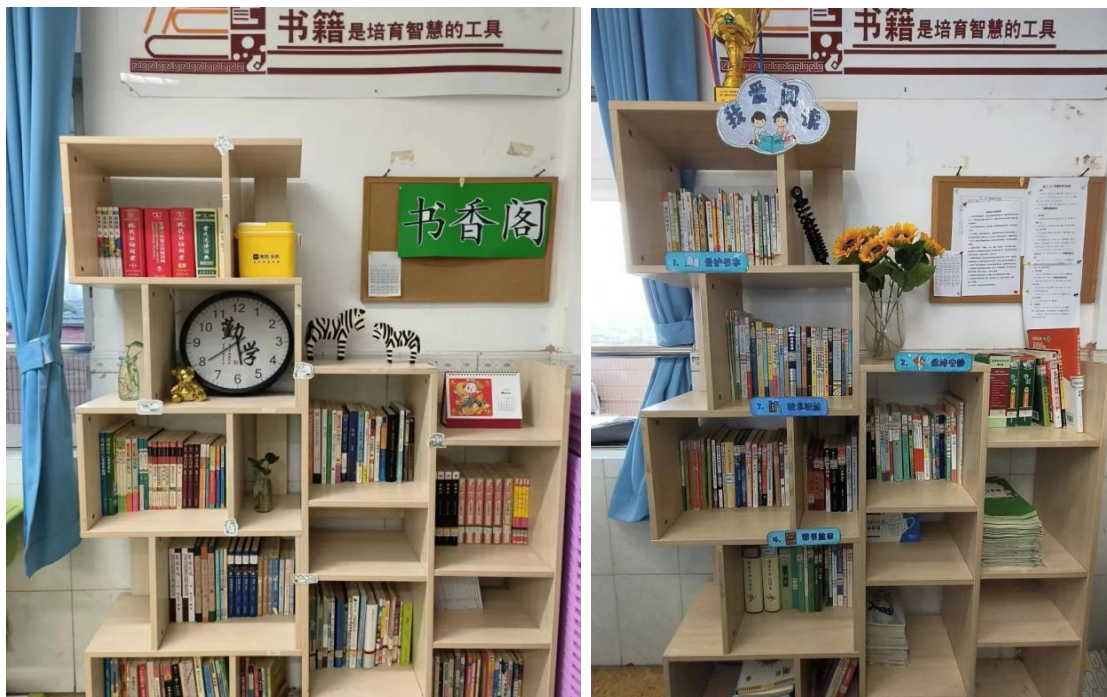
图 7: “最美图书角”评比活动